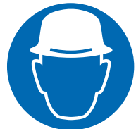
Draag een helm

Voor bescherming van het hoofd worden helmen gebruikt. Let op dat helmen niet gescheurd zijn, het binnenwerk niet versleten is e.d. Een kapotte helm moet vervangen worden. Daarnaast moet een helm goed passen.