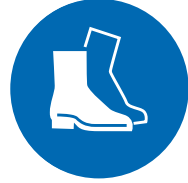
Draag veiligheidsschoenen / -laarzen

Gebruik, in ieder geval bij sanitairreiniging, handschoenen om infecties en eczeem te voorkomen.