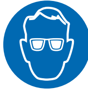
Draag een beschermingsbril (verplicht bij doseren van producten)